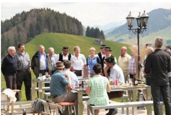
Jodlerkränzli - wie fast wie jedes Jahr