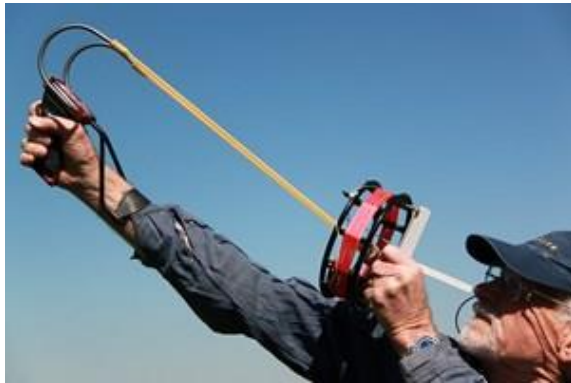
Jedes Jahr wieder- ein gezielter Schuss über einen 25m hohen Baum. Das gibt ein Aufhängepunkt für die 160m Antenne