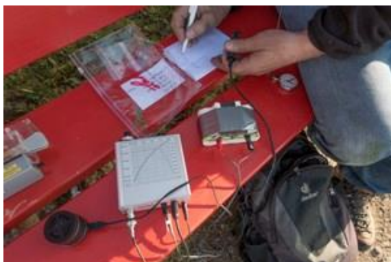
Sota-Probelauf einer MA-12 Station auf SOTA HB/AR-002