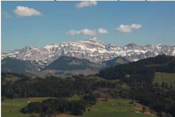
Der Säntis immer gegenwärtig