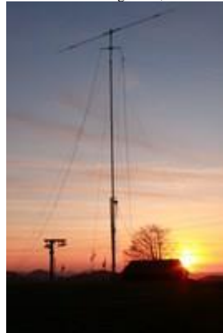
Abendstimmung auf dem Sitz