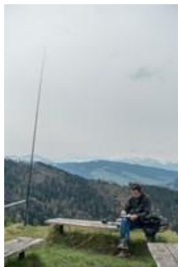
Clemens, HB9EWO auf Sota HB/SG-045