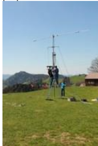
Multibanddipol wird im ŠTeamworkō und mit dem Hilfsmast auf 14m Höhe gebracht