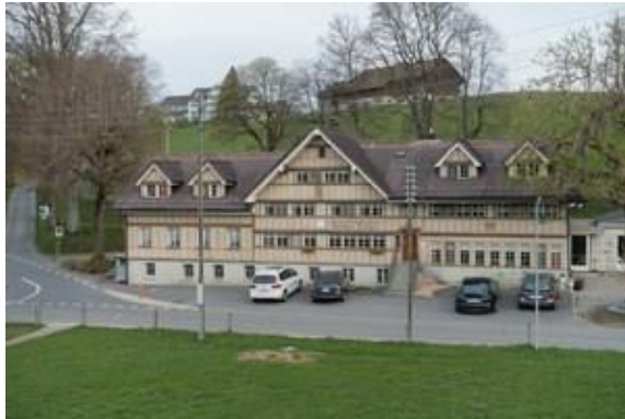
Man schläft ruhig in Schwellbrunn, einzig beim Gehen knacken halt die Holzbalken.