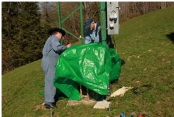
Die Anpassspule wird mit einer Plache vor Feuchtigkeit geschützt