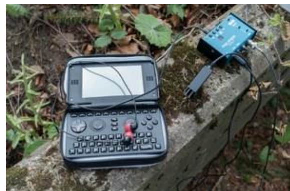
Sota Station mit selbstentwickelten elektronischem SOTA Log HB9TVK