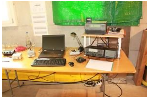
Die Station ist vorbereitet, Stand-By! Vor dem Fenster, hält die Plache das Sonnenlicht fern damit der Bildschirm für uns immer sichtbar bleibt!