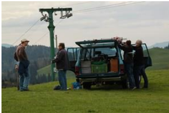
Fertig gepackt, es geht nach Hause, der Transport des Materials hat an diesem H26 ein Zentrale Rolle eingenommen. Tnx Clemens HB9EWO