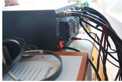
Expert - schaltet alle drei Antennen automatisch um