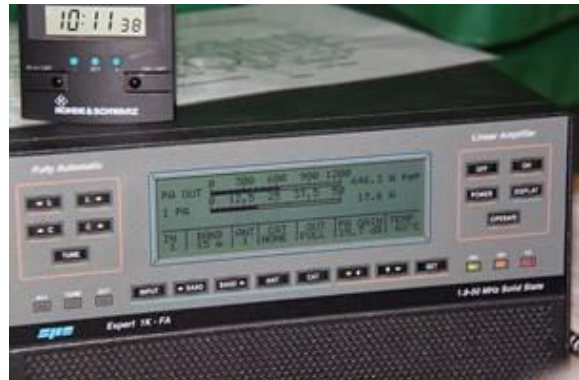
Hilft ö automatisch und grossartig! Die Expert