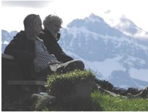
Es bleibt immer Zeit für einen gemütlichen Schwatz