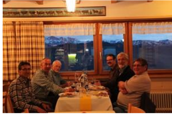
Grand-Dinner am Samstagabend, hier fehlt keiner!