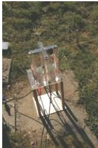
Homemade Anpassungsspule für den 160m Langdraht, der Speisepunkt ist so näher bei der Station